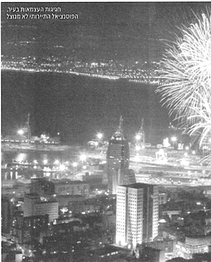
העיר התחתית והנמל. מחזקין להכפיל את שטחה

יוני שישי, כ"א בחשוון תשס"ח | 2.11.2007 | יריעות אחרונות